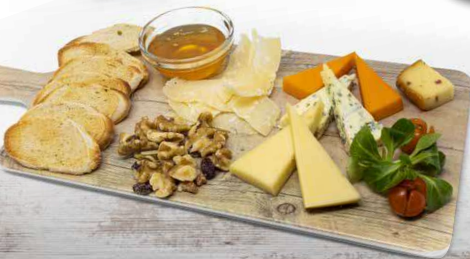
TABLA DE QUESOS